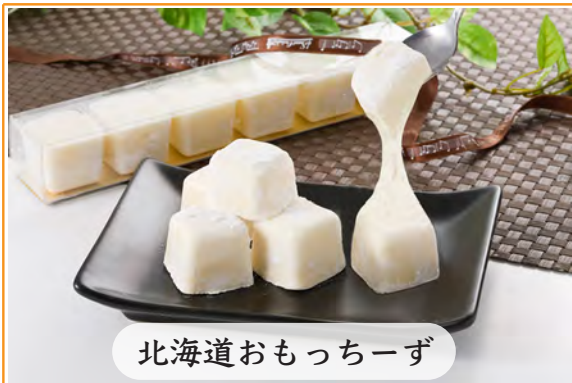
北海道おもちーず