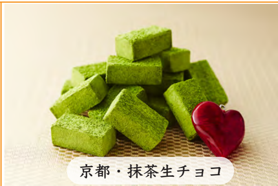
京都・抹茶生チョコ