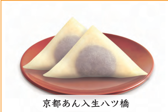
京都あん入生ハツ橋