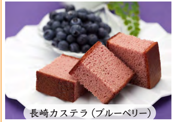
長崎カステラ(ブルーベリー)